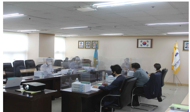
공모심사위원회 심사결과 토의

정부포상 추천기관으로 선정된 6개 기관의 훈격은 환경부 공적심사위원회 및 현장 검증 등을 통해 국무총리 표창(2개 기관), 환경부 장관상(2개 기관), 국토교통부 장관상(2개 기관) 등으로 확정될 예정이며, 하반기에 개최되는 ‘2021 순환골재·재활용제품 우수활용사례 발표회’에서 수여될 계획입니다.